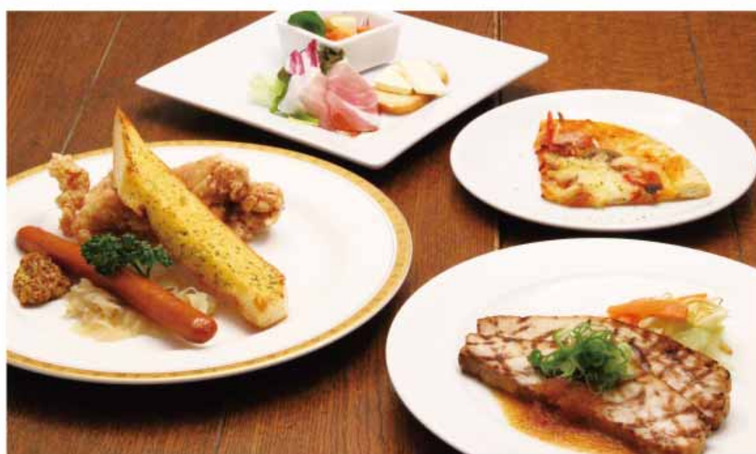
お手軽プラン集合写真