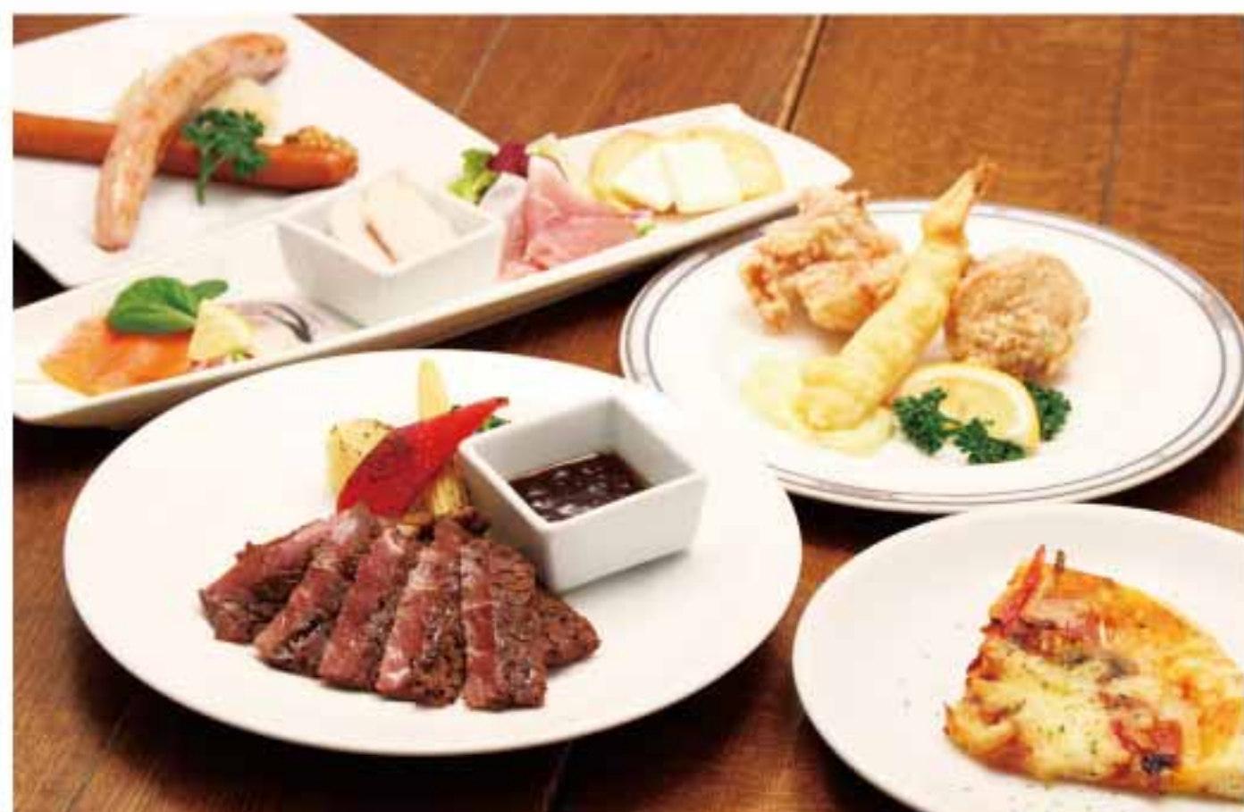
スタンダードプラン集合写真